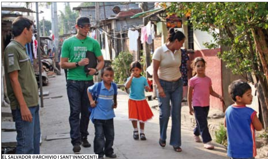
EL SALVADOR

L'esito di tale posizione umana è cresciuto nel tempo: all'inizio è stato un semplice corso di taglio e cucito per le ragazze, già giovanissime madri, cercando sul posto gli strumenti, gli insegnanti, i materiali, ma soprattutto cercando di vincere la diffidenza delle