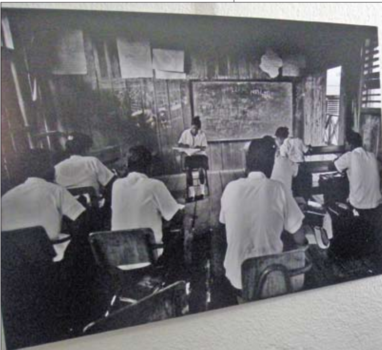
MOSTRA DI NANNI FONTANA.