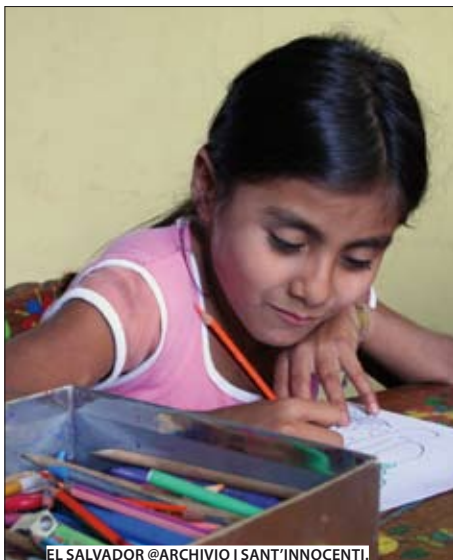
EL SALVADOR