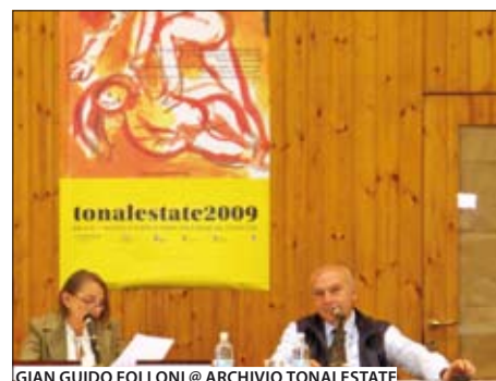
GIAN GUIDO FOLLONI @ ARCHIVIO TONALESTATE

paiono consapevoli che non bastano misure nazionali per tentare di rilanciare l'economia inceppata. Non bastano nemmeno le vecchie strategie di norma decise fra i grandi in quel contenitore che è stato in tempi recenti il G8. La prima condizione è ripristinare la fiducia delle diverse comunità umane nella possibilità di colmare il vuoto di governance. Inevitabilmente bisognerà, anche se con la necessaria gradualità, affrontare il problema fondamentale della messa in opera di un nuovo sistema internazionale. La formulazione di proposte volte a riformare la governance di un mondo caldo, piatto ed affollato richiede di superare le vecchie convinzioni, caratterizzate dal primato dei valori e del controllo dell'Occi-